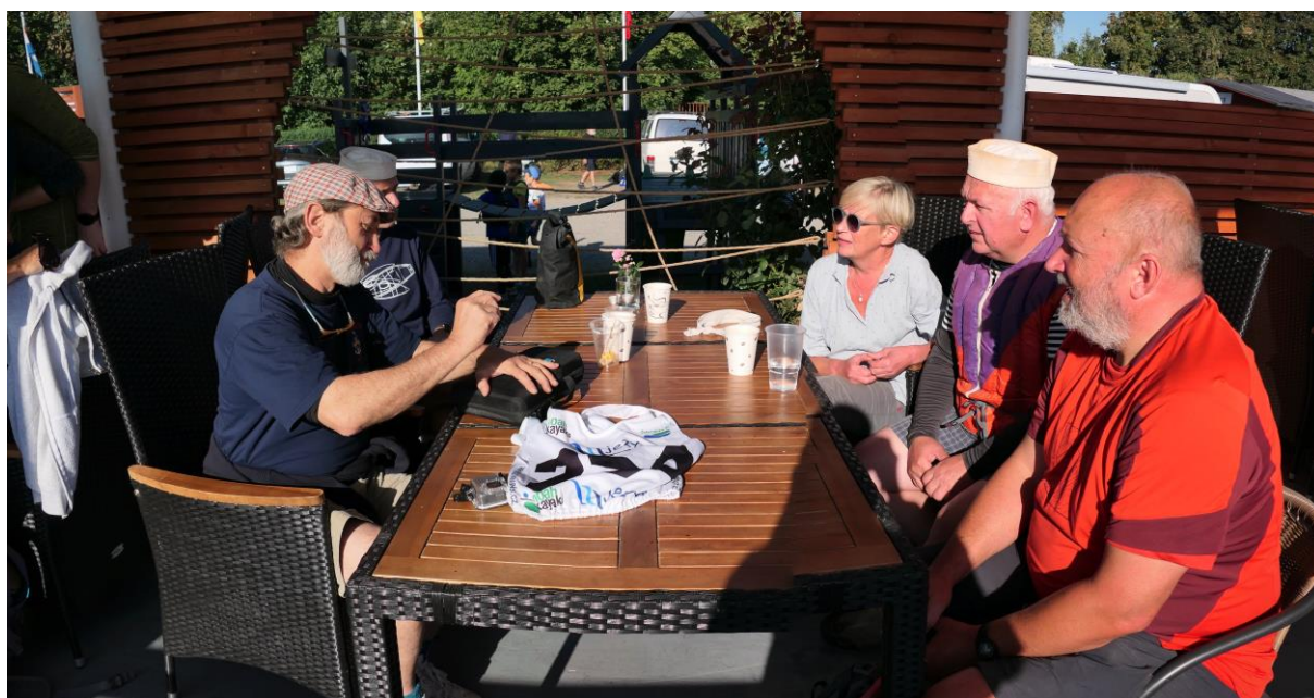
Posádka pramice Bari před naloděním