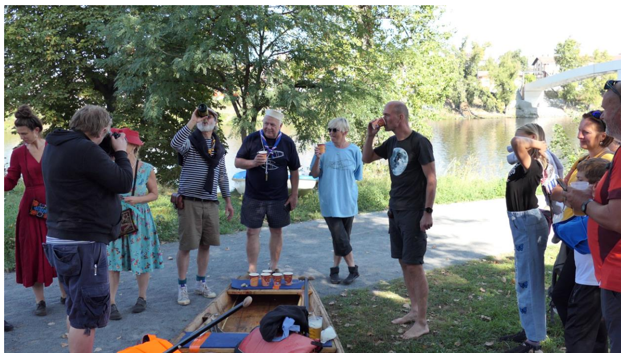
Přípitek po šťastném dopnutí do cíle