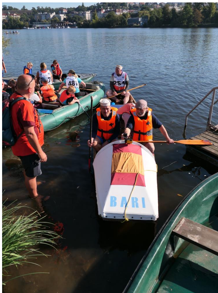
Před startem u mola